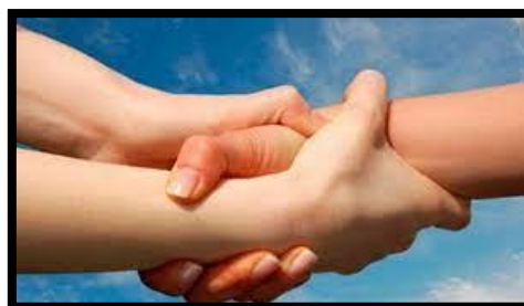
Mano que da ayuda y protección.